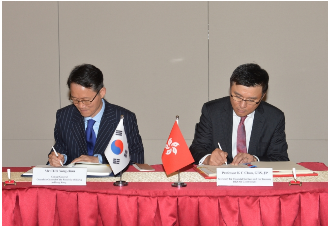
Mr CHO Yong-chun Consul-General Consulate-General of the Republic of Korea in Hong Kong